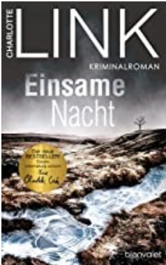
Charlotte Link: Einsame Nacht (Kate-Linville- Reihe, Band 4)

Mitten in den einsamen North York Moors fährt eine junge Frau allein in ihrem Wagen durch eine kalte Dezembernacht. Am nächsten Morgen findet man sie ermordet auf, in ihrem Auto, das fast zugeschneit auf einem Feldweg steht. Es gibt eine Zeugin, die beobachtet hat, dass ein Mann unterwegs bei ihr einstieg. Ihr Freund? Ein Fremder? Ihr Mörder? Kate Linville beginnt mit ihren Ermittlungen und ist schnell auf einer Spur, die in die Vergangenheit führt, zu einem Cold Case, in dem Caleb Hale damals ermittelt hat und der nie gelöst werden konnte... Klappentext)